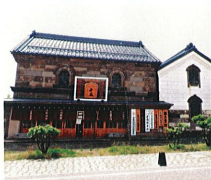
(石狩市 旧長野商店)