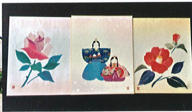
(和紙ちぎり絵体験作品例)