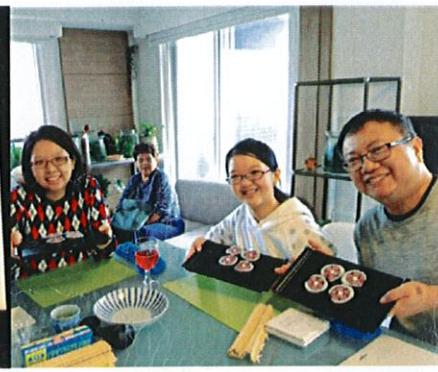
(シンガポールから来道)

石狩市で旅行業を営む当社は、地元ならではの特色あるツアープログラムや体験講座を企画運営しております。例えば、生産者と交流しながら野菜や果物の収穫を体験するアクティビティ、そば打ちやデコ巻き作りなどの文化体験、ちぎり絵やがま口などを作るハンドクラフト体験など、さまざまなプログラムをご用意しております。その他、交通や宿泊の手配など、各種旅のご相談を承っております。